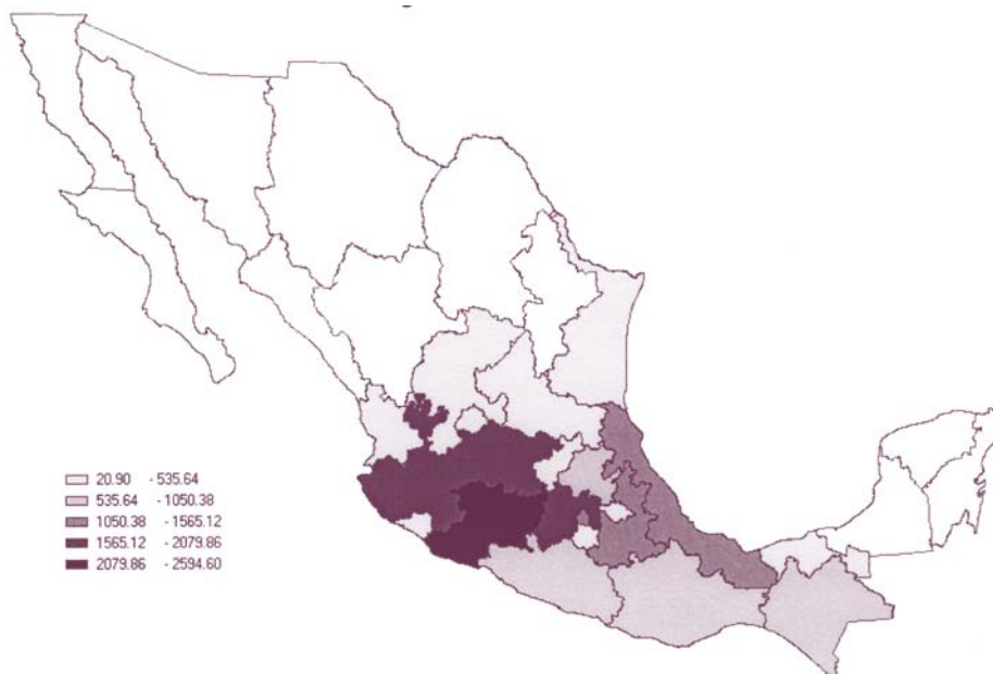
Mapa 1. Destino de las remesas de emigrantes mexicanos, 2005 (millones de dólares).