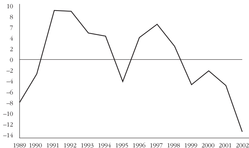
FIGURA 1. Porcentaje de crecimiento del PIB per cápita, 1989-2002

Fuente: IMF World Economic Outlook Database, 2002.