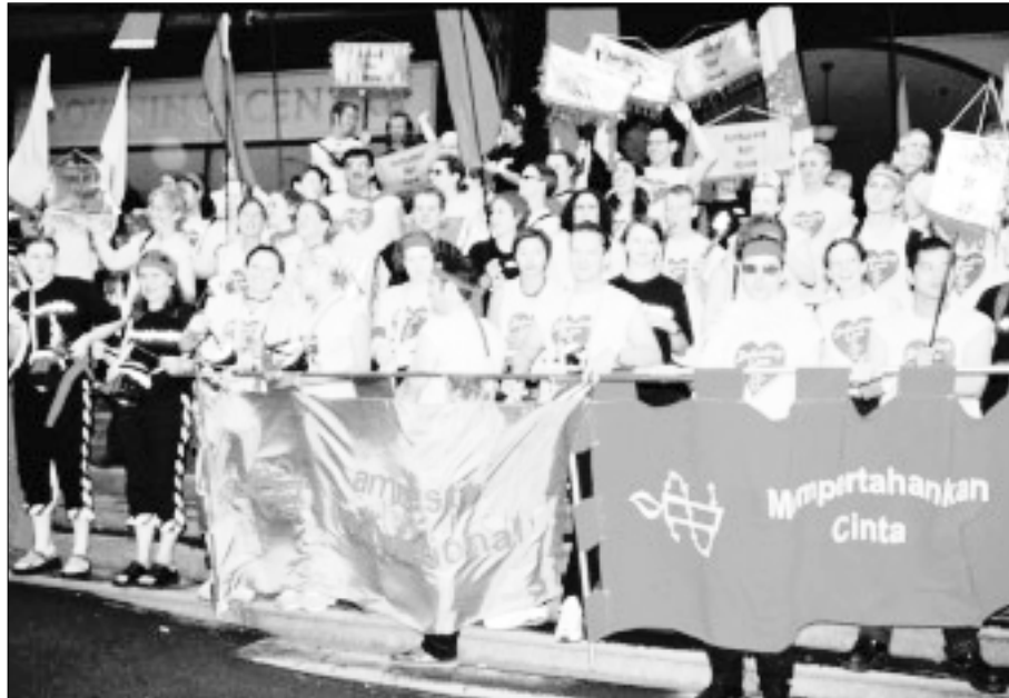
Miembros gays y lesbianas de Amnistía Internacional y otras personas, en el Desfile de Carnaval de Gays y Lesbianas celebrado en Sidney, Australia, en el 2001.

Tras numerosas protestas, en marzo del 2000, un ex jefe nacional de policía fue condenado a dos meses de prisión por darle una paliza a Anwar Ibrahim. Según los informes de que dispone Amnistía Internacional, no se ha juzgado a nadie por las torturas infligidas a Sukma Darmawan y a Munawar Anees. Los artículos del Código Penal aplicados siguen en vigor. 30