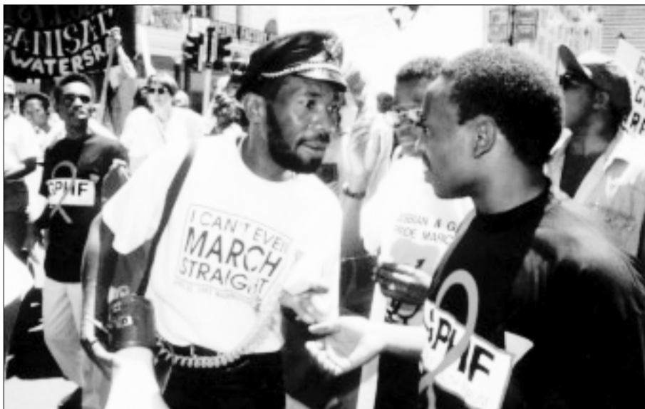
Marcha por los derechos de los gays, lesbianas, bisexuales y transexuales en Ciudad del Cabo, Sudáfrica, en 1993. En 1998, el Tribunal Constitucional de Sudáfrica resolvió que las leyes que penalizaban la sodomía (en referencia a los actos sexuales consentidos entre varones) vulneraban los derechos a la igualdad, la dignidad y la intimidad consagrados en la Constitución promulgada tras el fin del apartheid .

detenidos a la Unidad de Violaciones, donde fueron presuntamente objeto de agresiones sexuales, y luego los trasladaron al Centro de Prisión Preventiva donde tuvieron que limpiar las celdas de los demás reclusos y las letrinas con sus propias manos, sin guantes. Además, la policía incitó a otros internos a que los agredieran y dejó sus celdas sin cerrar para que pudieran entrar otros presos y golpearlos.