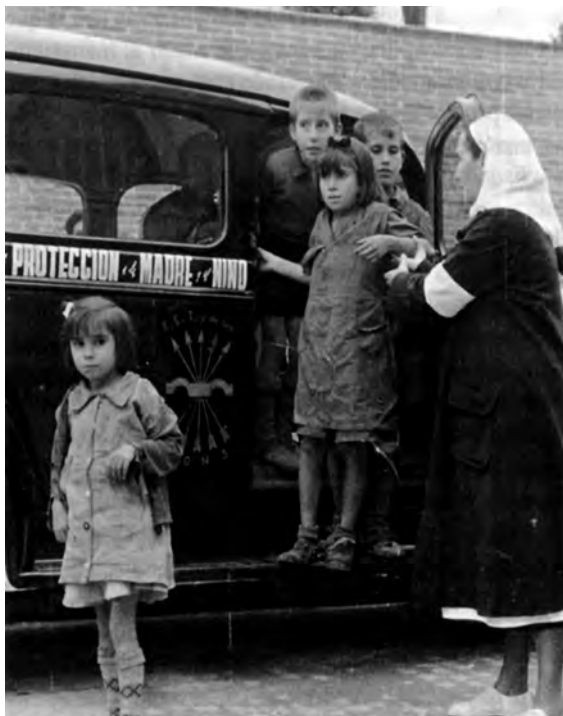
Autor: Hermes Pato. Tomada de la web de SBHAC www.sbhac.net .