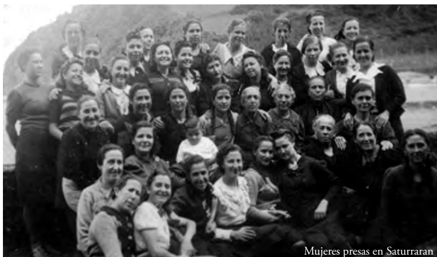
Mujeres presas en Saturrarán