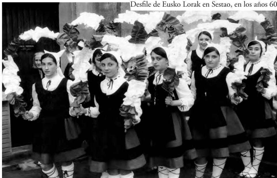
Desfile de Eusko Lorak en Sestao, en los años 60

Cualquier exteriorización del sentimiento nacionalista sería perseguida por el régimen franquista hasta el final de la dictadura, aunque a partir de los años 60 se produjo cierta tolerancia hacia los grupos que cultivaban el folklore tradicional.